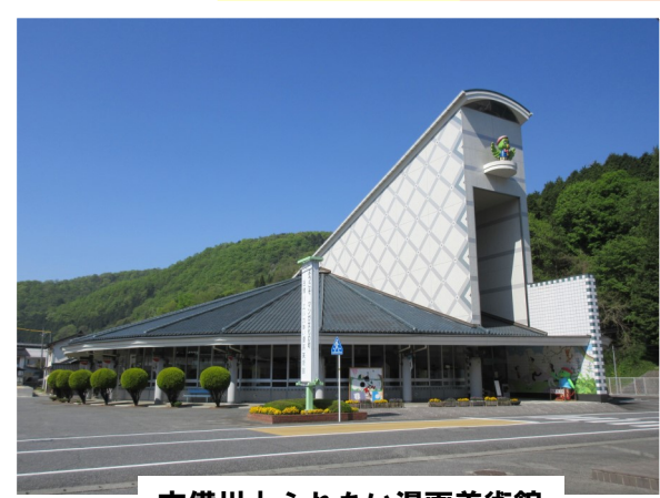
吉備川上ふれあい漫画美術館

写真展 岩合光昭の日本ねこ歩き 迫田岳臣 古代ガラス復元への挑戦 ※2024年7月現在